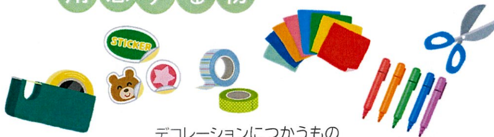
デコレーションにつかうもの